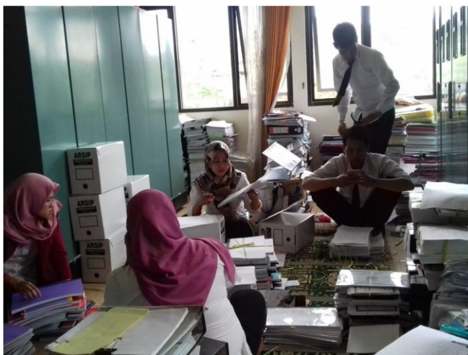
Gambar. 2 Proses Pengolahan Arsip In Aktif

Sedangkan Adanya tanggapan yang positif dari instansi terkait terhadap penyelamatan dan penataan arsip daerah di OPD, hal ini terlihat dari respon positif mengenai akuisisi arsip in aktif dan banyaknya permintaan pendampingan pengelolaan arsip di masing-masing instansi. Arsip-arsip yang telah diakuisisi tersebut selanjutnya disimpan dalam Depo Arsip Kota Parepare.